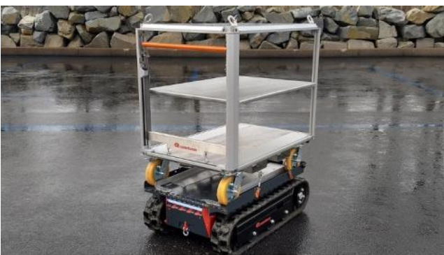
CC81E-A111 - Kuljetettava mobiililaite (high position)