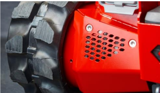
Tehokkaat 48 V sähkömoottorit teloille