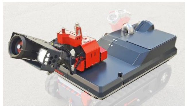
CC81J-A101 - moduuli RM35C (jopa 3 800 l/min 10 baarilla)