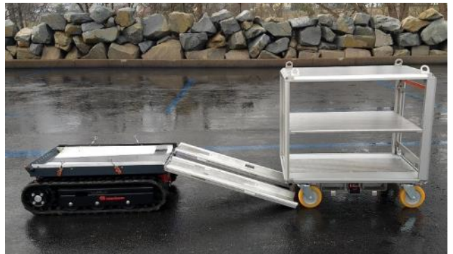
Moduuliteline, jossa ramppi