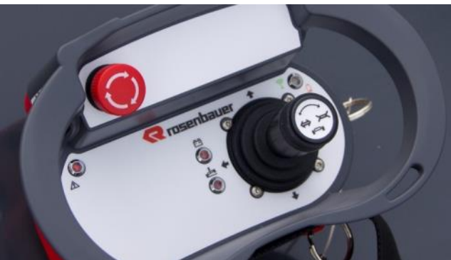
Langaton kaukosäädin robotille