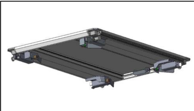
CC81A-A101 - hyötykuormamoduuli 800 x 1200 mm