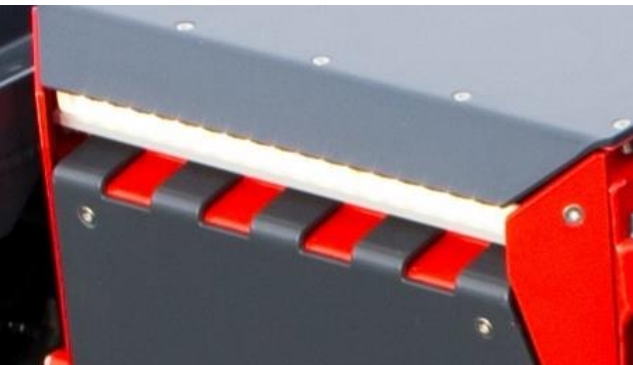
Integroitu LED-valo edessä