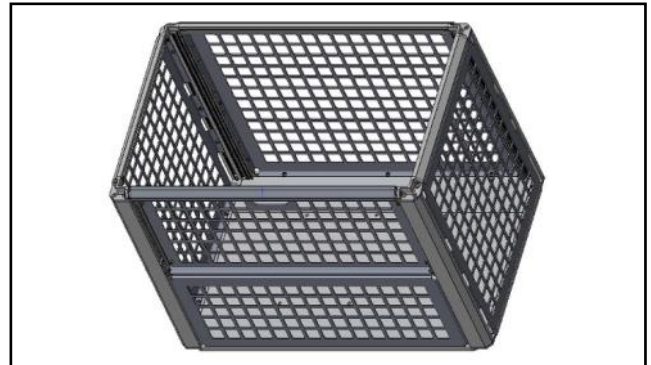
CC81A-A501 - hyötykuormamoduulin verkkolaatikko