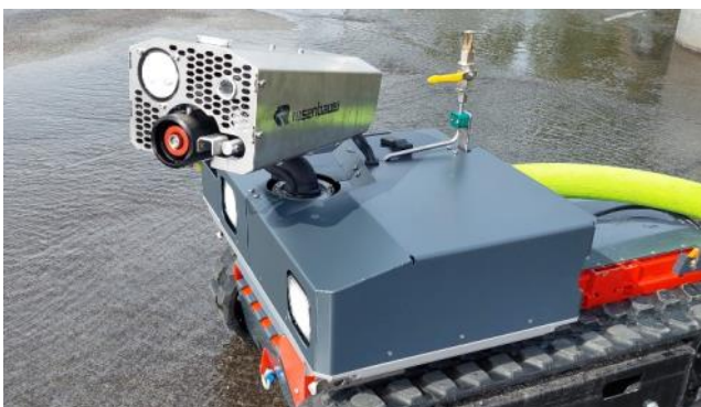
CC81G-A101 - moduuli RM15C (jopa 2 000 l/min 10 baarilla)