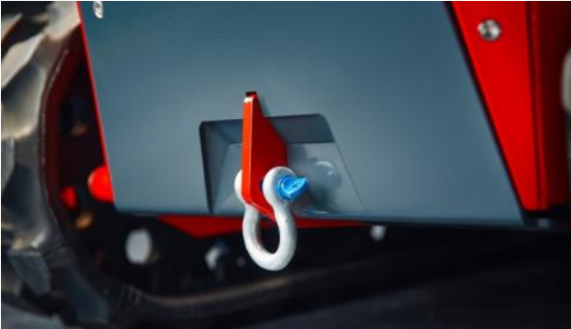
Tukeva etuosa vetolenkillä