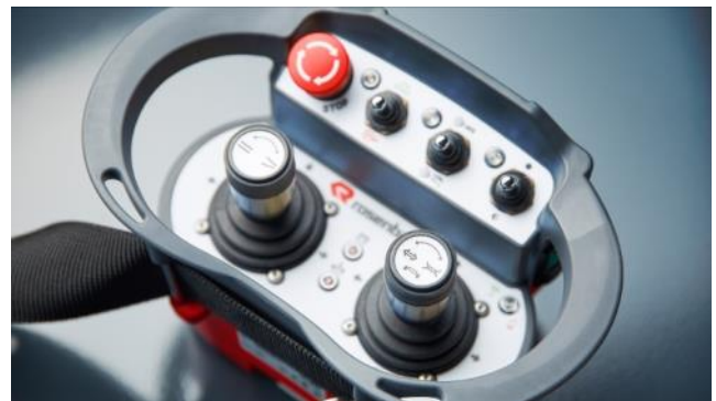
Langaton kaukosäädin robotille ja vesitykille