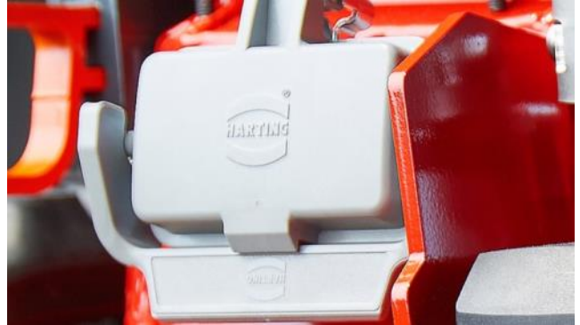
Yhdistetty lataus- ja liitäntäpiste