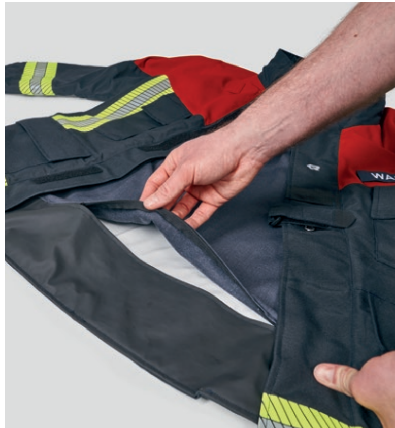
Tarkastusaukon avulla voit tarkistaa kalvon nopeasti ja helposti.

Ulkomateriaali on NOMEX® NXT, joka kestää erittäin hyvin mekaanista rasitusta ja korkeita lämpötiloja. Pitkäkestoisella vedenpitävällä pinnoitteella se säilyttää kykynsä hylkiä likaa ja vettä useiden vuosien ajan. Tämä varmistaa, että alla oleva hengittävä kalvo ja siten käyttäjä on täysin suojattu.