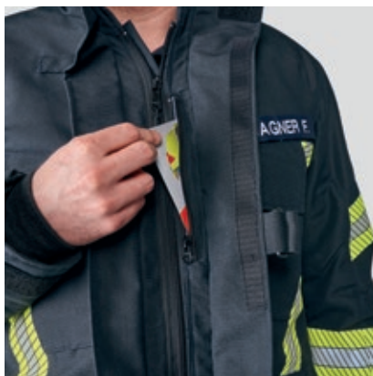
1410625 Napoleon tasku