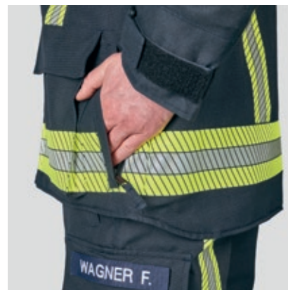
1409504 viistot sivutaskut